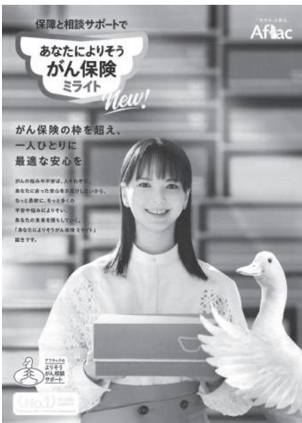
あなたによりそうがん保険 ミライ

これまで本紙でご案内している通り、現在個別扱でアフラック保険に加入されている組合員の方は、団体扱契約への切り替えが適用されます。保障内容は変わらず、そのまま継続できる点が大きな特長です。