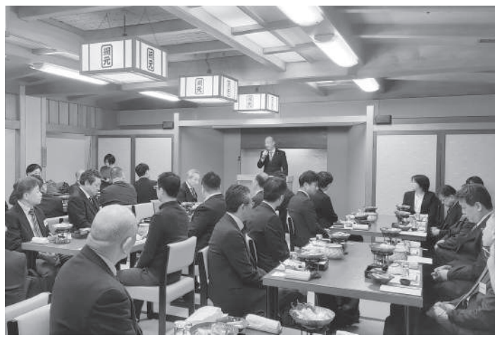
組合員・商友会・各界来賓を招いて開かれた新年会

新年の門出を祝う恒例の新年会が1月22日、網元本館で開かれ、組合員・商友会・各界来賓を招いて開かれた新年会